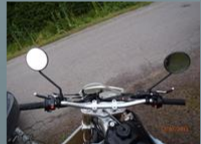
Ohjaamo sopii 180 senttiselle