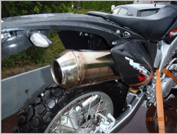
Rosteria putket alusta loppuun ja äänet maltilliset

Metsäautotietä ja paikoin varsin ruohottunutta pätkää löytyi aina vaan lisää, kunnes saavuin ensimmäiseen märkään paikkaan. Monstra sai siis ensimmäisen tulikasteen paikassa, jossa mönkijämiehet alkaa olla elementissään. Pääsin ensimmäisen pehmeän paikan ohi, vaikka stumppasinkin koneen pariin otteeseen. Mönkijämies keskipakokytkimineen ei ollutkaan tottunut käsikytkimen kanssa pelaamiseen, vaan laite sammahteli osaamattomuuttani. Toki osa hankaluudesta löytyi hieman liian pitkästä toisiovälityksestä möyrimistouhuihin, joten pienen osan sammuilusta vieritän toisiovedon piikkiin. Sehän on toki säädettävissä, joten hankalampaan maastoon voisin suositella tiheämpää välitystä.