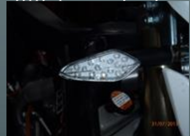
Valot nykyaikaista LED tekniikkaa

Raajärvi saatiin päätökseen ja nokka kohti etelää. Täällä ajoin keskisellä Uudellamaalla sekä sora- että asfaltteita ja nyt välitykset oli kohdillaan. Erittäin hyvällä alaväännöllä varustettu 450 cc yksimukinen veti eleettömästi aivan alarekisteristä asti antaen hyvin kyytiä rajoittimeen saakka. Nyt välitykset oli kohdillaan ja matka taittui varsin maltillisilla kierroksilla. Myös polttoainetta kului kohtuulliset 4,5 l / 100 km. Kaasunkäyttö oli kaikkea muuta kuin pihistelevä. Työmatka-ajoon en sellaisenaan voi suositella, sillä 40 km työmaalle sujui kyllä, mutta ehkä matka-ajoon soveltuu jokin muu ajoneuvo paremmin. Tämä laite on selkeästi mutkaisille asfaltti, hiekka- ja metsäautoteille tehty iloittelulaite. Ja ennen kaikkea edullinen sellainen. Rekisterissä hintaa kertyy on noin 5000€ ja se on kohtuullinen hinta varsin toimivasta tieliikennerekisteröidystä takuupelistä.