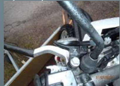
Ryppyvipu auttaa käynnistyksessä